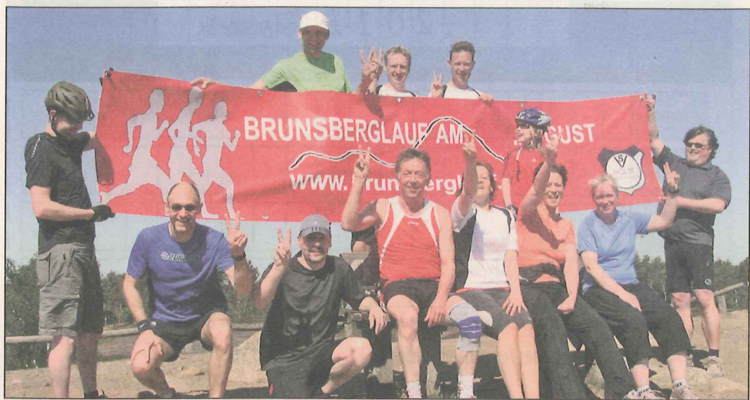
Auf dem „Gipfel“: Die Laufgruppe Holm-Seppensen trainiert jetzt regelmäßig sonntags für den Brunsberglauf Ende August